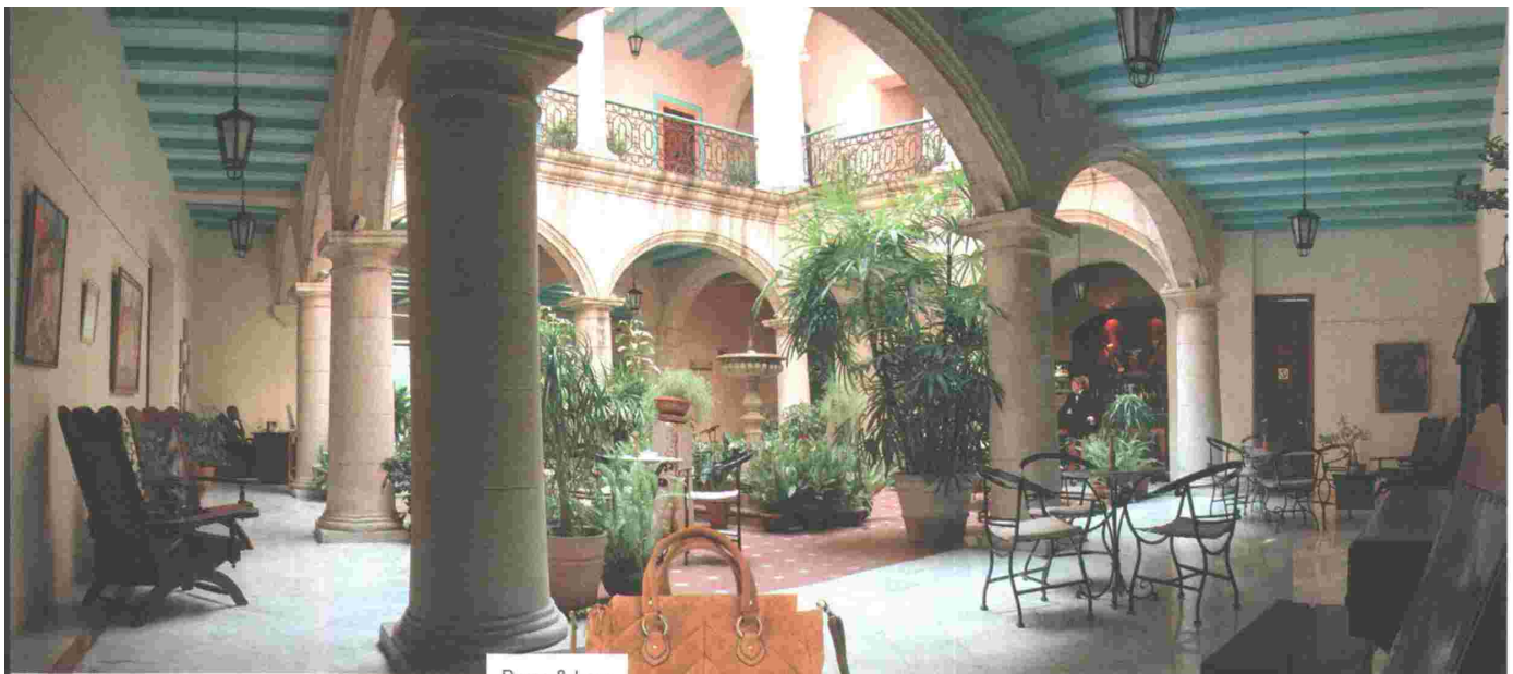
BIMBA & LOLA (140 €).