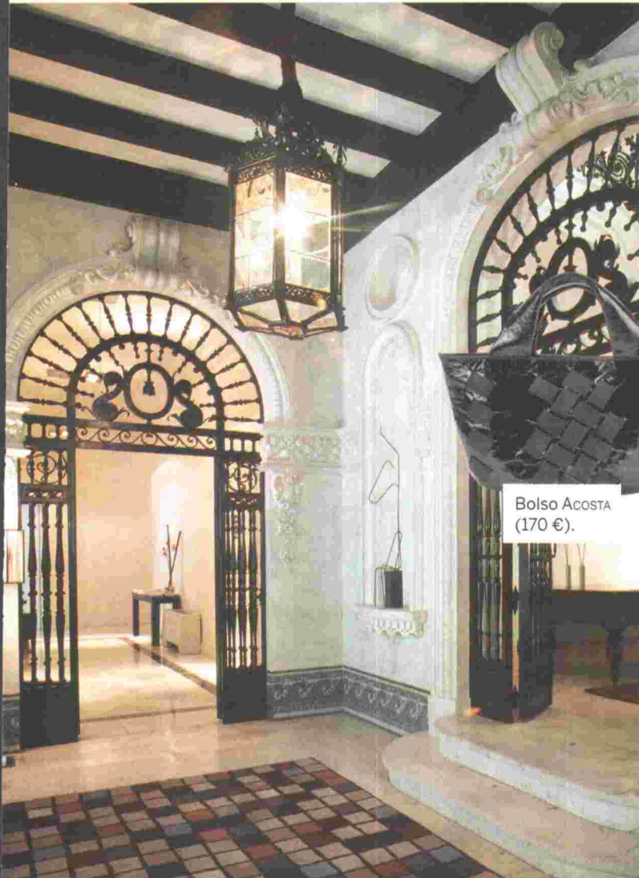
Bolso ACOSTA (170 €).