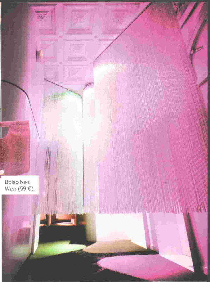
Bolso NINE West (59 €).

Te recomendamos: Cena en el White Bar (30 €) y disfruta después de las sesiones del dj Toni Rox (viernes y sábados noche). Dónde: Princesa, 50. Barcelona. Tel. 932 954 652. Precio: Desde 118 €/noche. www.chicandbasic.com