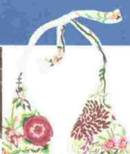
Biquini VICTORIO & LUCCHINO (112 €).