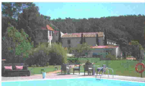
Una de las tres piscinas del hotel. Al lado, el restaurante.

cicletas del hotel para descubrir las hermosas rutas forestales. Lo más: Su restaurante, un mix de cocina mediterránea vanguardista con platos del Empordà. Dónde: Castell, Palamós (Girona). Tel. 972 312 330. www.lamalcontentahotel.com