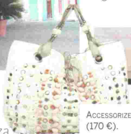
ACCESSORIZE (170 €).