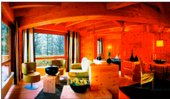
Das Naturhotel Waldklause im österreichischen Ötztal setzt auf natürliche Materialien.

Gast wählt gemäss seiner Laune die Zimmerfarbe aus und bestimmt damit auch die Fassade: denn durch die grossen Fensterfronten wird das Farbspiel nach aussen transferiert. Auch in Barcelona findet sich ein Hotel, welches sich dem Mood-Management mit Hilfe von Lichtstimmung, Düften und Musik verschrieben hat. Es ist das «Chic & Basic», welches in einem historischen Gebäude untergebracht ist und ein Raumkonzept mit weissen Flächen verfolgt, die in verschiedenen Farben beleuchtet werden.