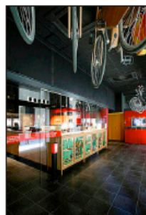
Die Leihräder sind im Entrée des Casa Campa in Barcelona geparkt.

«Ökosign», sprich den echten und natürlichen Materialien. Beispielsweise? Was genau unter «moodig» verstanden werden kann, zeigt das Design Hotel Nordic Light in Stockholm auf eindrückliche Art und Weise. In diesem Hotel spielt das Licht die zentrale Rolle. Die Hotelzimmer wurden in «mood rooms» umbenannt und erstrahlen in allen erdenklichen Farbtönen: von entspannendem Grün bis hin zum romantischen Rosa ist alles möglich. Der