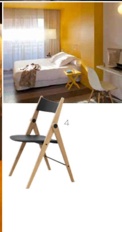
1 Kraftige poser til opbevaring, 2 stk., 129 kr. fra Bloomingville. 2 Venice lampe, h 162 x diam. 40 cm, 1.499 kr. fra Ilva. 3 Cantina flise, 12 kr. fra Fired Earth. 4 Oslo stol h 82 x b 43 cm, 1.379 kr. fra Bo Concept. 5 Vintagekuffert, b 65 x d 40 cm x h 20 cm, 550 kr. hos rubernoclassics.dk 6 Lack bord, h 55 x b 55 cm, 59 kr. fra Ikea. 7 Magnetiske nøglefugle 'birp on the wall', 149 kr. stk. hos bischoff-living.dk 8 Arkitekttegnet trappestige, 2.995 kr. hos hindevadgaard.dk 9 Lampe, diam. 30 cm, 1.500 kr. fra Madam Stoltz. 10 Sengebord, h 50 x b 30 x l 45 cm, 1.599 kr. fra Bloomingville. 11 Skål designet af Rebecca Uth for Ro, h 13,5 x diam. 22 cm, 600 kr. 12 Toulouse kombineret billardbord og spisebord, 215 x 120 cm, 12.995 kr. hos billardbutikken.dk